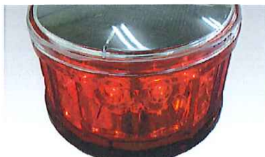
光源にLEDを採用しており長寿命です。