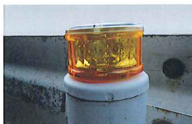
磁性構造物への設置が可能です。

*仕様は予告無く変更になる場合があります。あらかじめご了承下さい。 *印刷物の為、実際の色と異なる場合があります。