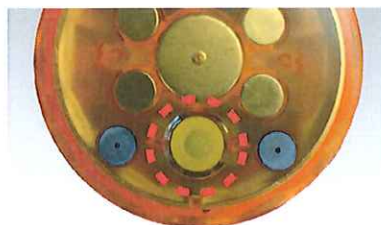
底面のスイッチを押すと点灯します。押す毎に点灯モードが切り替わります。